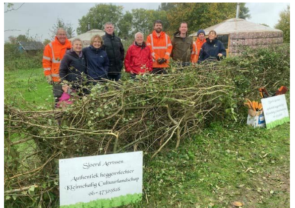
Nieuwe kansen benutten in het landschap

Bestuur Vereniging Vrijwillig Landschapsbeheer Beuningen