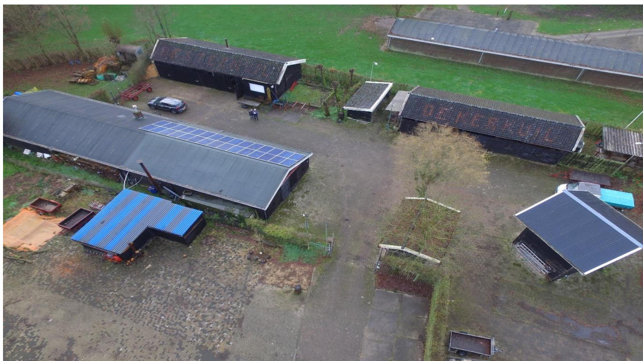
De Werf met hooimijt, metaal- en houtwerkplaats, opslagplaatsen voor hout, landbouwmachines en gereedschap, een lokaal/kantine en een zaaggebouw.