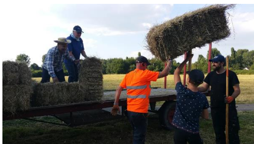
Maaien en hooien