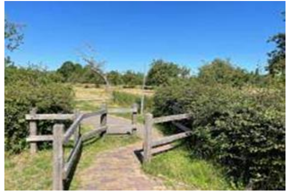
Bijdragen aan bloeiende en boeiende parken