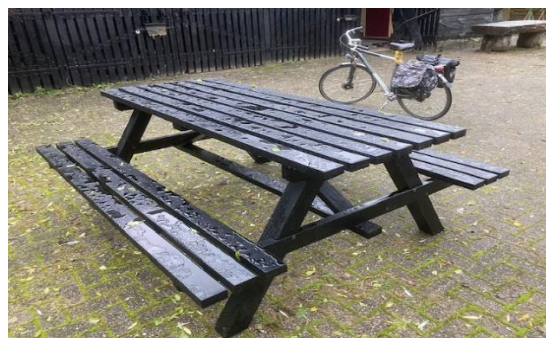
Diverse houten buitenmeubels, trappen, bruggen etc.