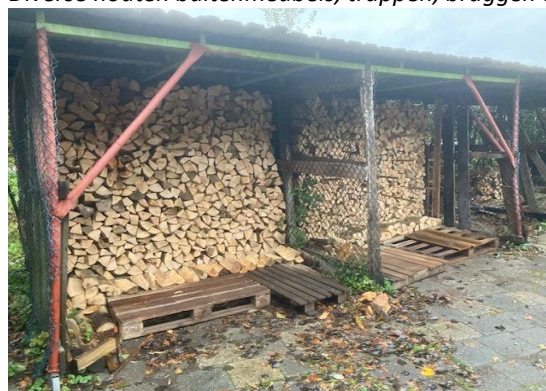
Zagen, kloven en verkoop haardhout