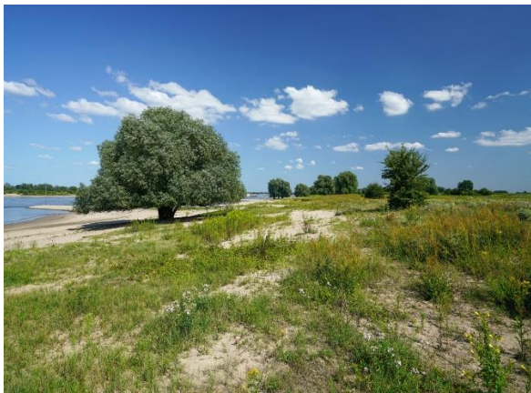
Ruimte voor rivier en water