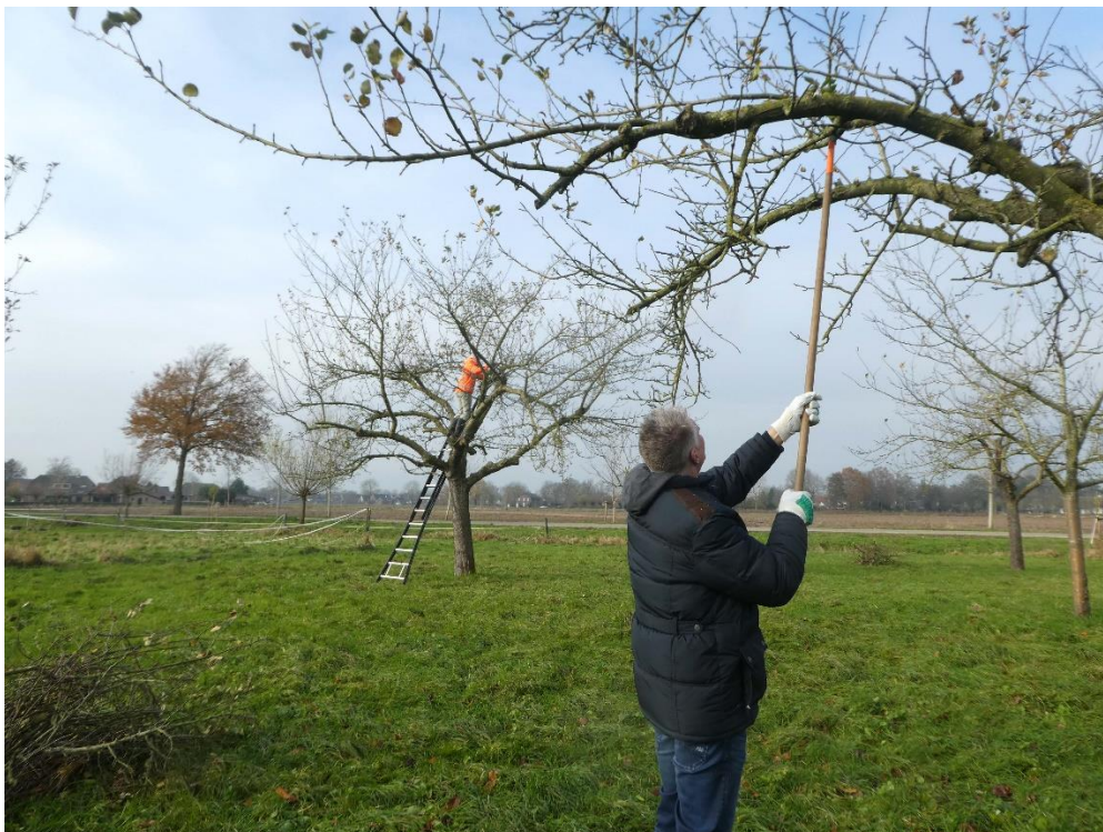
Onderhoud van hoogstamfruitbomen in Beuningen