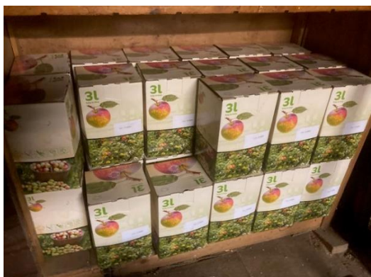
Appelsap uit de boomgaarden