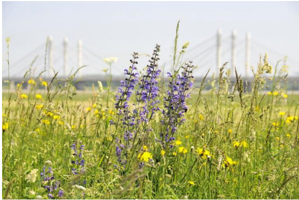
Meer heemplanten en biodiversiteit bij dijk en uiterwaarden

Vereniging Vrijwillig Landschapsbeheer Beuningen (VLB)