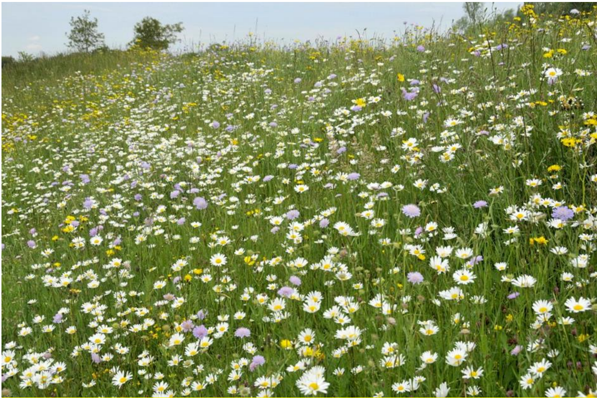
Bloeiende dijkellingen in gemeente Beuningen